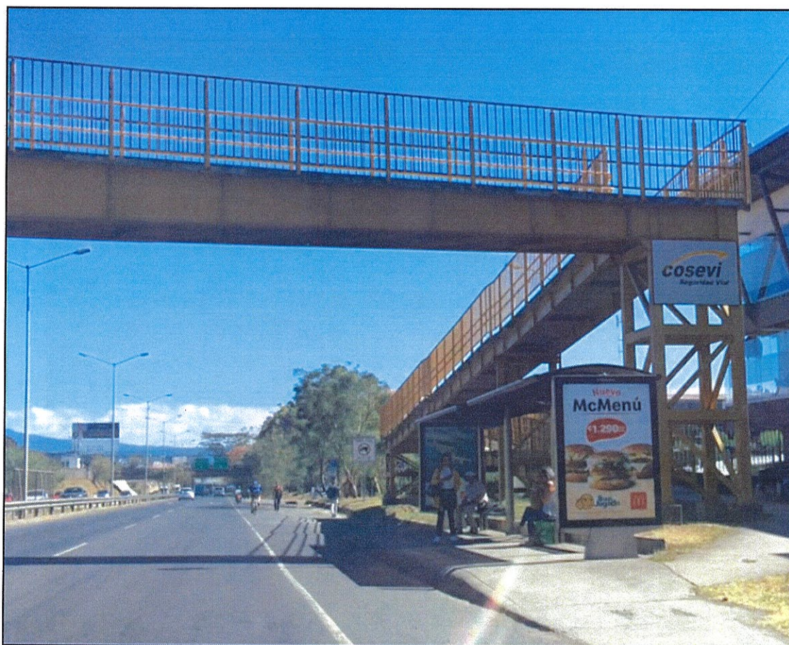
Figura 2. Fotografía de la parada en estudio

En la siguiente imagen se muestra una fotografía de la parada, se observa que la parada cuenta con estructura de caseta y que se encuentra contigua al puente peatonal.