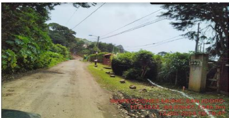
Anexo 4: Proyección de Futura ampliación de carretera, 12 de agosto del 2024.

1 2 3 4 5 6 7 8 9 10 11 12 13 14 15 16 17 18 19 20 21 22 23 24 25 26 27 28 29 30