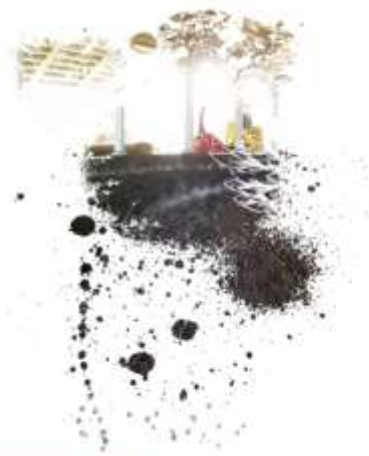
PLAN PILOTO COMPOSTAJE DE RESIDUOS ORGÁNICOS SAN ISIDRO DE HEREDIA