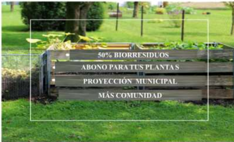
"PLAN PILOTO COMPOSTAJE DE RESIDUOS ORGANICOS SAN ISIDRO DE HEREDIA"

1 2 3 4 5 6 7 8 9 10 11 12 13 14 15 16 17 18 19 20 21 22 23 24 25 26 27 28 29 30