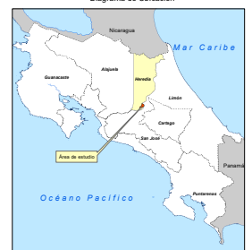
Diagrama de Ubicación