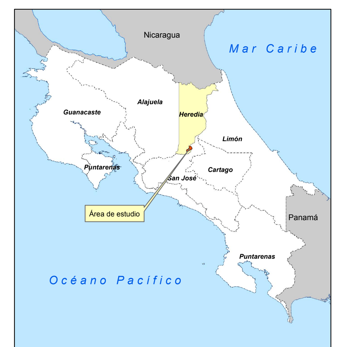
MATRIZ DE INFORMACIÓN DE VALORES DE TERRENOS POR ZONAS HOMOGÉNEAS PROVINCIA 4 DE HEREDIA CANTÓN 06 SAN ISIDRO DISTRITO 03 CONCEPCIÓN